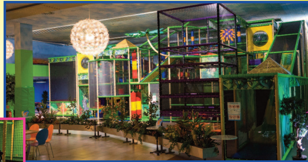
Großer Kletterturm bis 12 Jahre

Der große Kletterturm mit vielen Hindernissen, Funshooter, Spidertower, Elektrokart-Bahn, Doppelrutsche, Spiralrutsche und Kindertrampolinanlage.